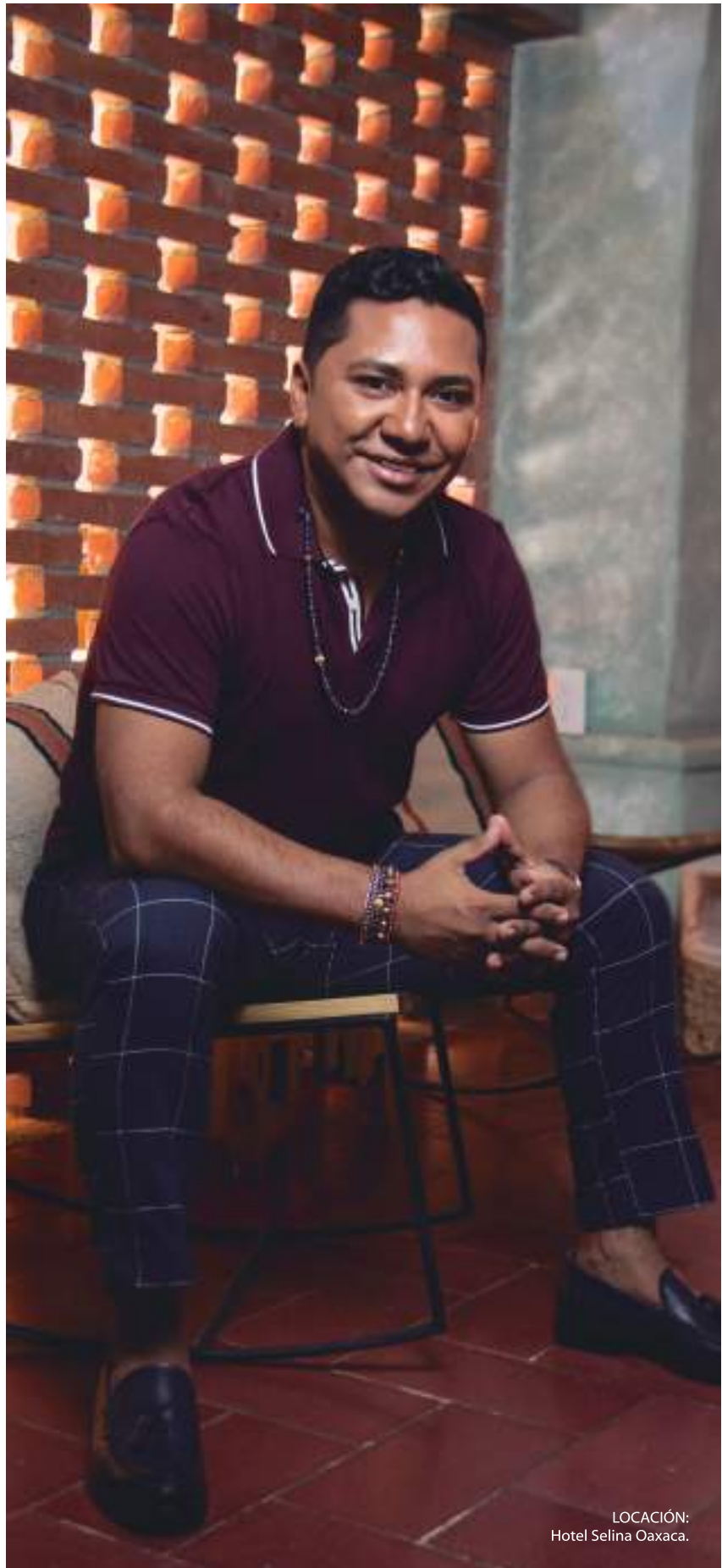
LOCACIÓN: Hotel Selina Oaxaca.

Desde su apertura, el reto más grande al que se ha enfrentado constantemente es a trabajar a marchas forzadas para sacar a tiempo los pedidos de los clientes y la producción para venta en general.