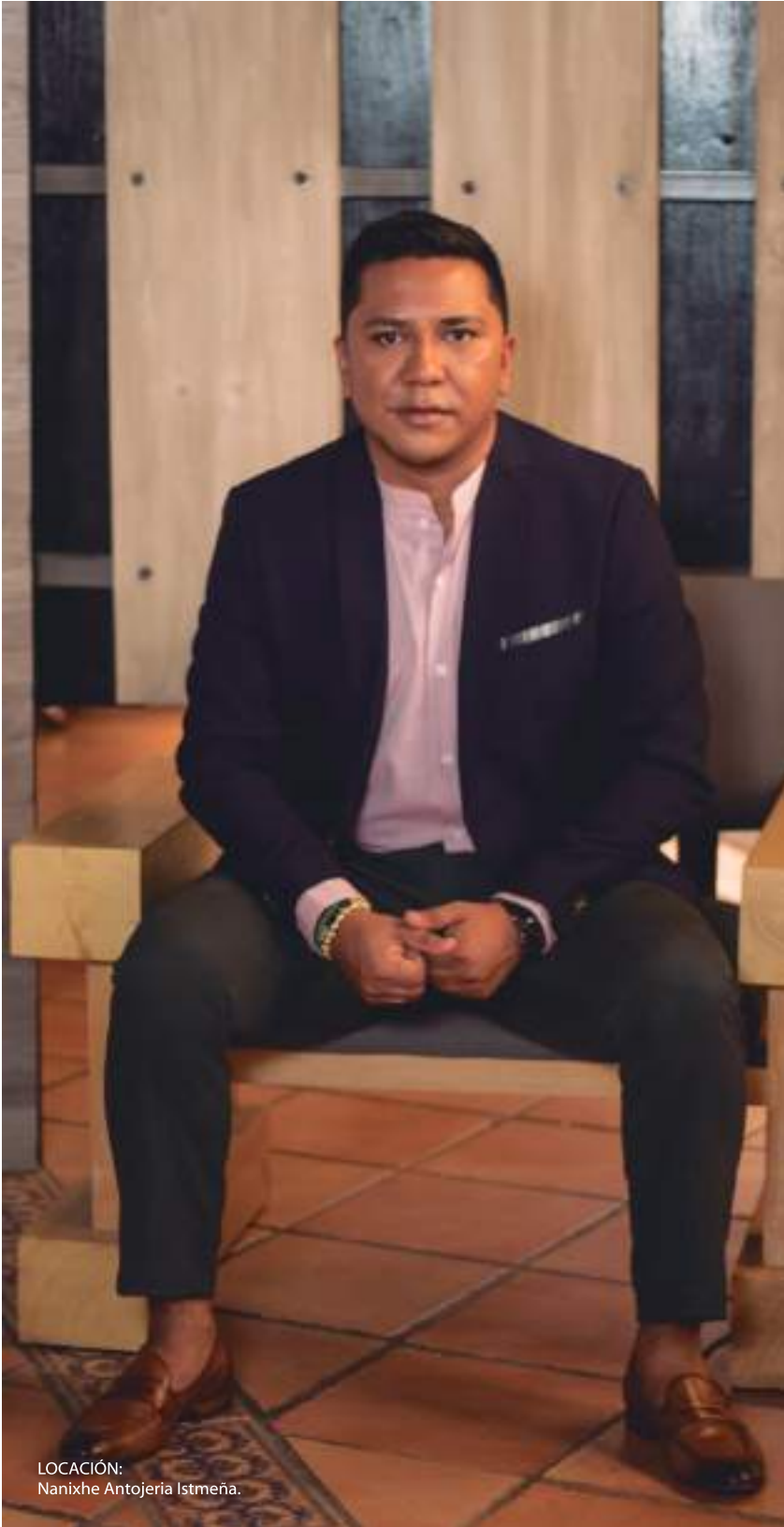
LOCACIÓN: Nanixhe Antojería Istmeña.

piezas personalizadas y con historia”, por ello, “siempre estoy capacitándome para aprender nuevas técnicas en joyería, aprendiendo a trabajar con materiales innovadores para ofrecer vanguardia y variedad a mis clientes”.