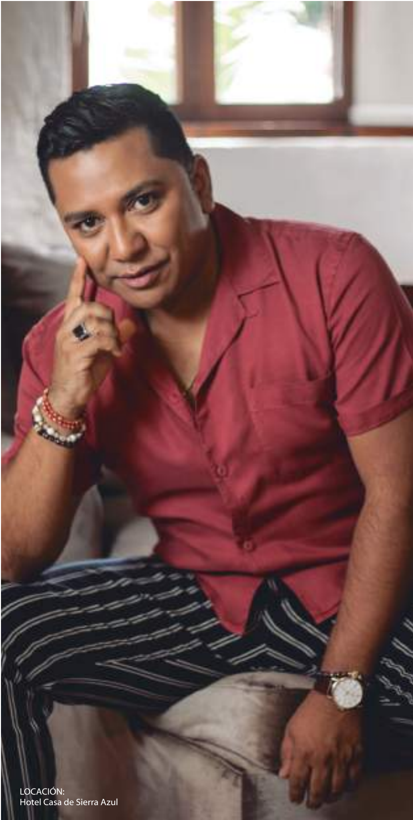
LOCACIÓN: Hotel Casa de Sierra Azul

“Somos lo que somos y estamos donde estamos, por lo que hemos hecho en el pasado”.