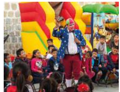
Los asistentes, divirtiéndose con el show de payasos.