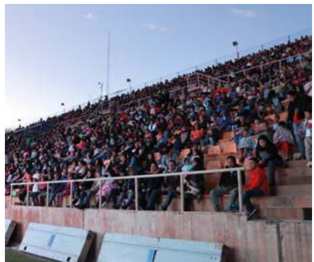
El público gozando del espectáculo.