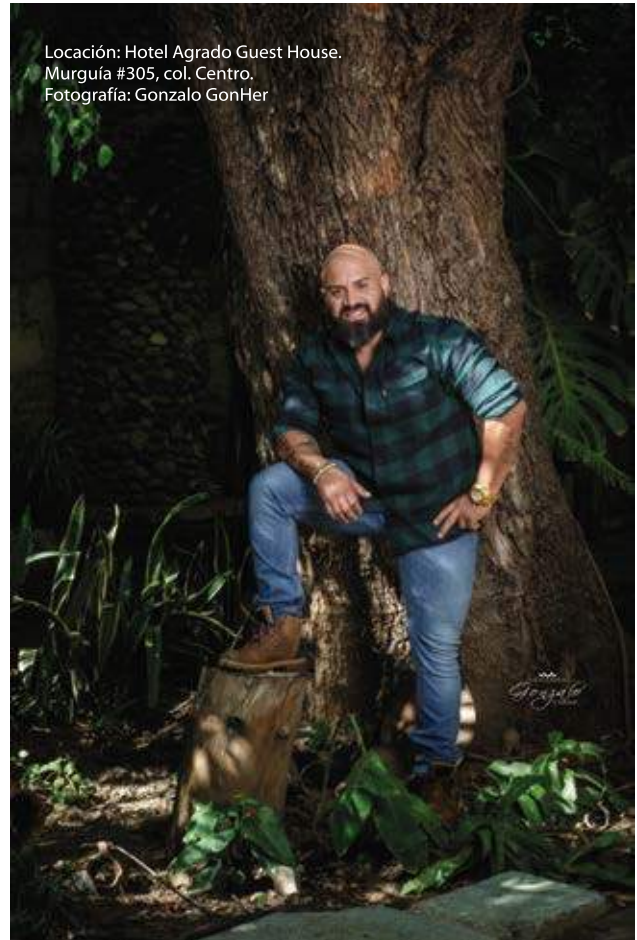
Locación: Hotel Agrado Guest House. Murguía #305, col. Centro.

Life Coach: son talleres motivacionales o sesiones uno a uno o en grupo, en un espacio agradable y cómodo para darle solución a los problemas cotidianos de la vida, haciéndolos saber que ellos (como individuos) son lo más importante.