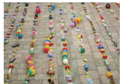
Debido al gran apoyo que existió hacia la causa, la meta fue superada.