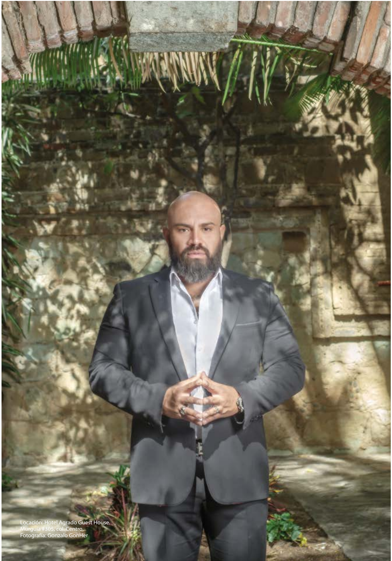
Locación: Hotel Agrado Guest House. Murguía #305, col. Centro.