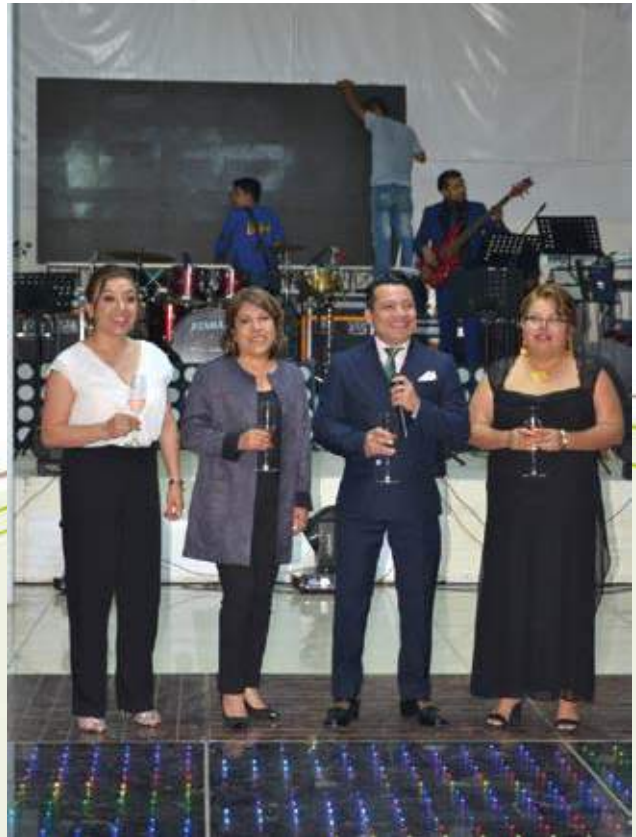
El equipo que inició esta gran empresa.