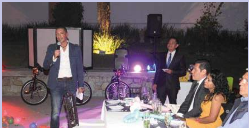
Se vivió un emotivo momento cuando el Director General de MVM dirigió un mensaje de fin de año a su equipo.